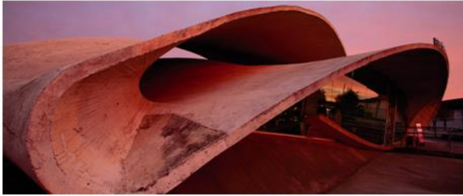
Estación de autobuses. Casar de Cáceres, Extremadura.

La arquitectura contemporánea se ha convertido en otro de los protagonistas de la Ruta y a lo largo del itinerario se encuentran muestras de las últimas tendencias arquitectónicas.