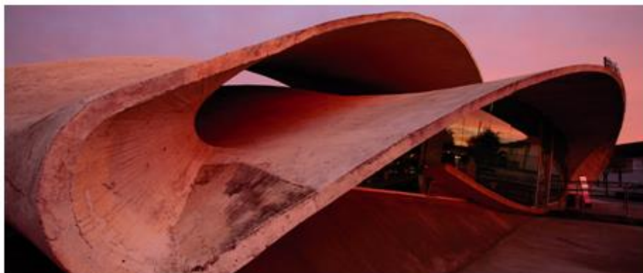
Estación de autobuses. Casar de Cáceres, Extremadura.

La arquitectura contemporánea se ha convertido en otro de los protagonistas de la ruta y a lo largo del itinerario se encuentran muestras de las últimas tendencias arquitectónicas.