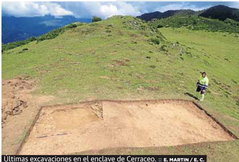
Últimas excavaciones en el enclave de Carraceo.